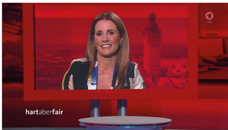
Moderatorin Mareile Höppner

Besonders wichtig für sie und ihren Sohn: „Wir machen viel Sport draußen!“