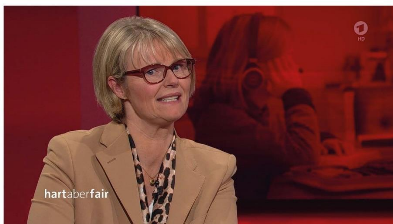
Bundesministerin für Bildung und Forschung Anja Karliczek

Die Unternehmen müssten gefälligst selber ein Interesse am Infektionsschutz haben, meint Karliczek kühl. In den Schulen dagegen „gibt es einen öffentlichen Auftrag, den wir zu erfüllen haben!“